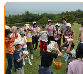
地域の子どもたちと活動を行うなどして、幅広い実践力を養います。