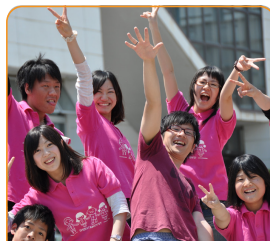
コース制度をとっており、学生同士のふれあいを大切にしています。