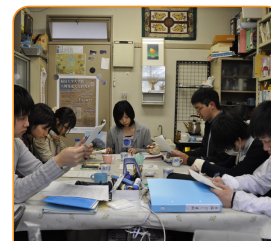
学生の協働を重視し、21世紀に求められる確かな実力を持つ教員を養成しています。