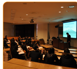
討論や資料の収集、調査、まとめ、発表の方法など、実践に即して学びます。