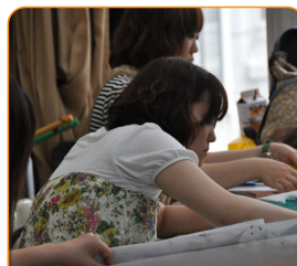
実物を通して、様々な知識・技術と人間や社会との結びつきを追求します。