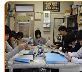
学生の協働を重視し、21世紀に求められる確かな実力を持つ教員を養成しています。