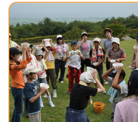
地域の子どもたちと活動を行うなどして、幅広い実践力を養います。