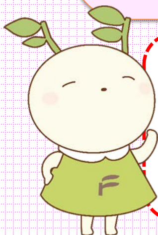
福島大学公式マスコットキャラクター めばえちゃん

現役の大学院生による体験談も あります。入学後のことや受験 対策についても遠慮なくお尋ね ください。