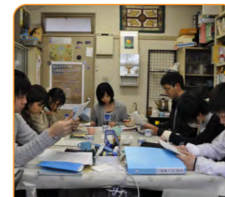
学生の協働を重視し、21世紀に求められる確かな実力を持つ教員を養成しています。