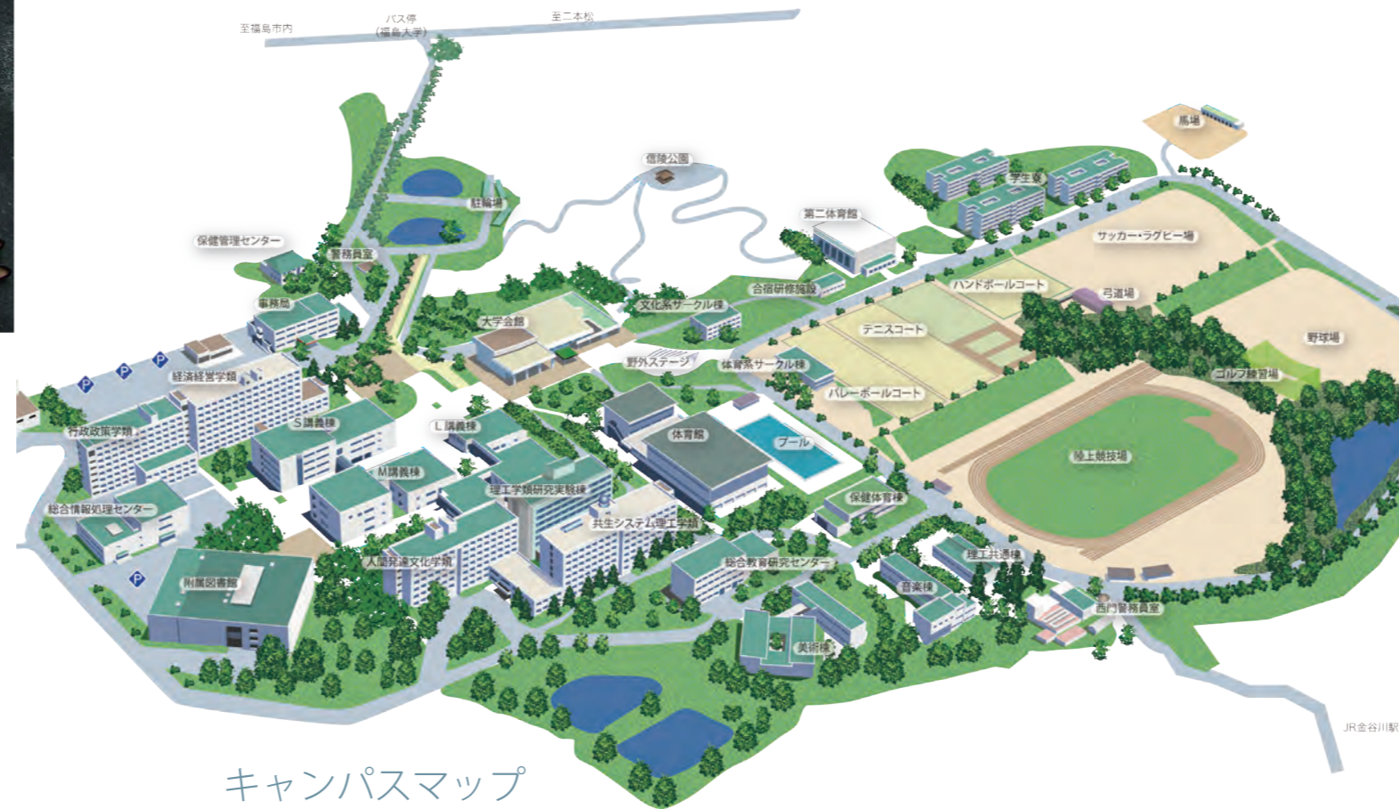
キャンパスマップ

大学まで JR:東北本線金谷川駅下車徒歩10分 バス:福島駅から二本松方面行き乗車、福島大学前下車徒歩10分