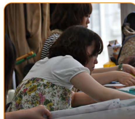
実物を通して、様々な知識・技術と人間や社会との結びつきを追求します。