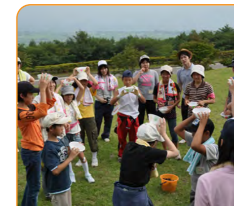
地域の子どもたちと活動を行うなどして、幅広い実践力を養います。