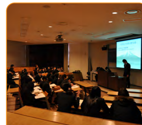
討論や資料の収集、調査、まとめ、発表の方法など、実践に即して学びます。