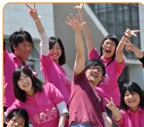
コース制度をとっており、学生同士のふれあいを大切にしています。

これからの時代に求められる、人間を深く理解し、豊かな社会・文化を築くために必要な幅広い分野の授業科目がそろっています。それぞれのコースには、専門知識・技術の確実な定着と、認知的・社会的スキルの高度化を図るための学習プログラムとして、コース専門プログラムが置かれています。コース専門プログラムを道標として、自分の目的にしたがって専門を追求したいという方に最適です。